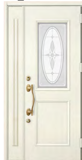
アスティホワイト