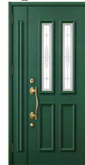
クィーンズグリーン