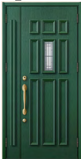
クィーンズグリーン