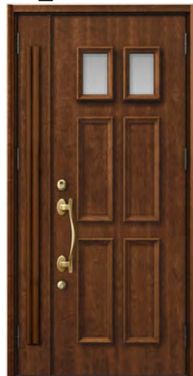
ハンドダウンチェリー