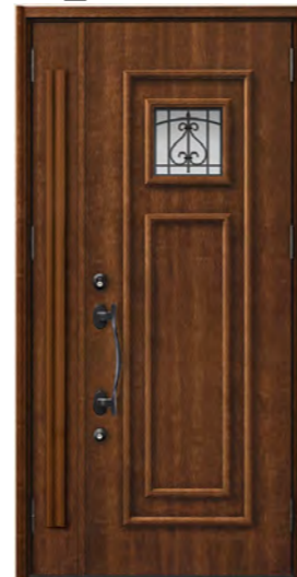
ハンドダウンチェリー