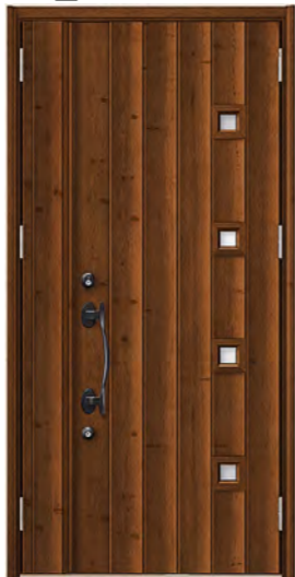
アイリッシュパイン